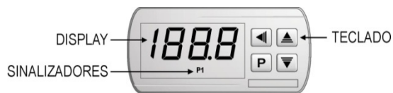
Fig. 02 – Painel frontal do controlador

No painel frontal do controlador o sinalizador P1 acende quando a saída de controle é ligada.