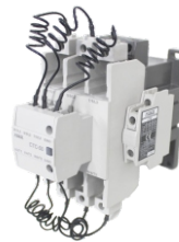
Para CT50 a CT85 For CT50 to CT85 CTC-50