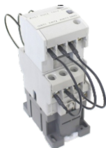
Para CT9 a CT40 For CT9 to CT40 CTC-9